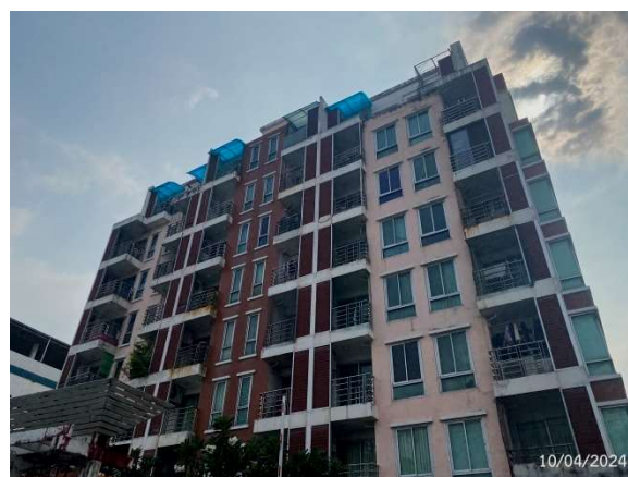
รูปที่ 1.5-1 สภาพปัจจุบันของโครงการ